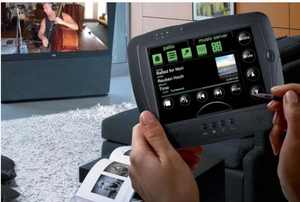
Painel Touch Screen Wi-Fi

A cadeira Home Office da linha Trabalho da Saccaro é muito confortável para escritórios, com linhas sóbrias e aconchegantes ela possui estrutura em lâmina imbuída de pomela e alumínio. Saccaro, 0800-541-1199.